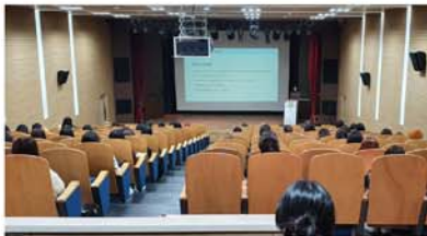
2020 산업체인사 특강