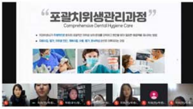
2020 전공심화 논문발표(온라인)