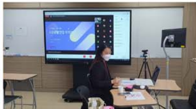
2021 산업체인사 특강(온라인)